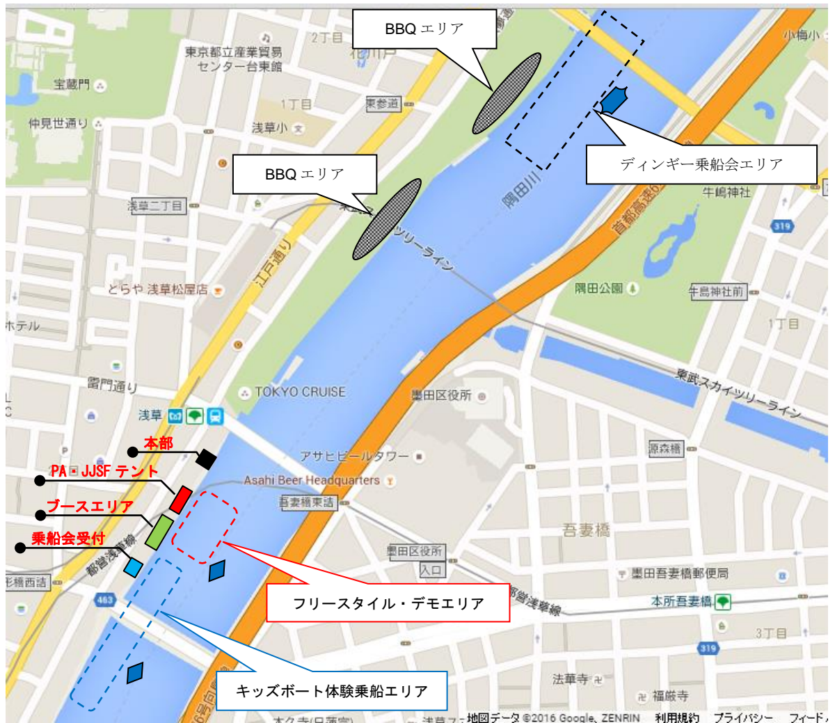
【フリースタイル・デモエリア】