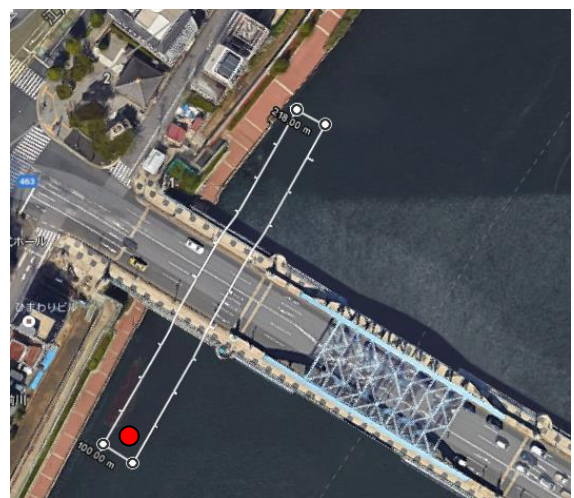
【キッズボート乗船会エリア】